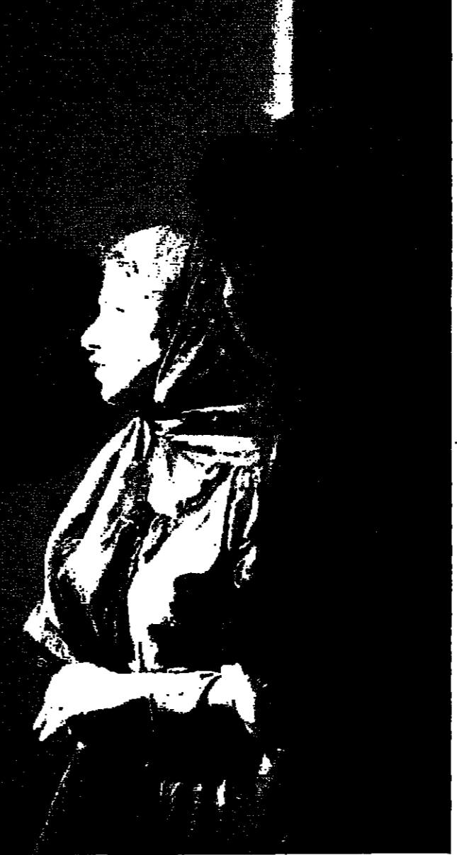
مشهد من مسرحية بيت بدارنا اياه

تتلقاه الايدي بشوق كبير وتهال عليه عروض العمل الفني غير ان كل ذلك لم يتحقق وعرض ان يعمل الخريجون في مجال تخصصهم.